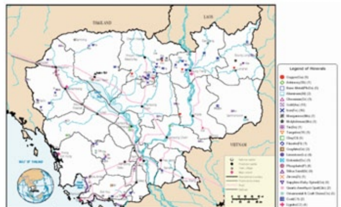
図4 カンボジア鉱産図（鉱山局）