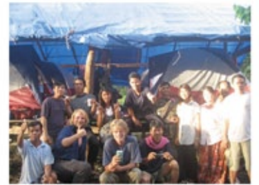
肥沃なカンボジアの資源